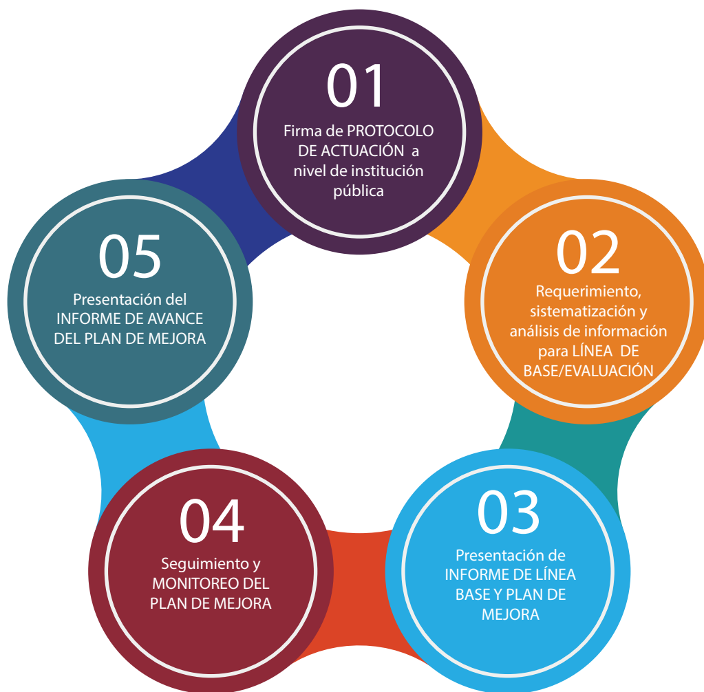
Gráfico 1. Ciclo del proceso de elaboración y monitoreo del plan de mejora